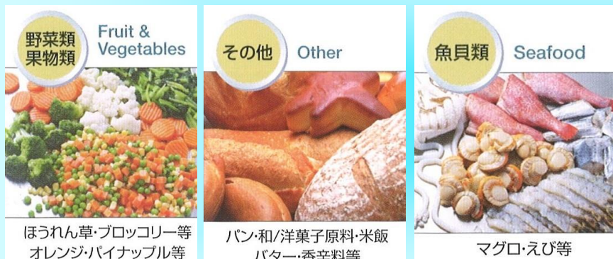
ほうれん草・ブロッコリー等 オレンジ・パイナップル等