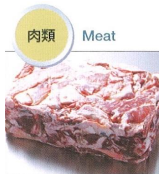
牛肉・豚肉・鶏肉 ハンバーグ等